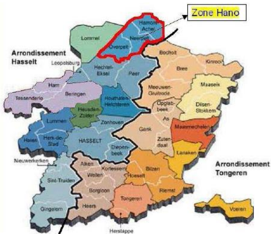
Figuur 1.1 Lokalisatie zone HANO ( http://www.lokalopolitie.be )

slachtofferhulp, lokale recherche en handhaving van de openbare orde. Bij de lokale politie wordt er gewerkt met politiezones. Een politiezone kan één of meerdere gemeentes omvatten. De lokale politie HANO is, zoals de naam al doet vermoeden, dan ook een meergemeentenzone en bestaat uit de gemeentes Hamont-Achel, Neerpelt en Overpelt. Het volledige werkingsgebied van de zone omvat 12 726 Ha en telt circa. 45.500 inwoners.