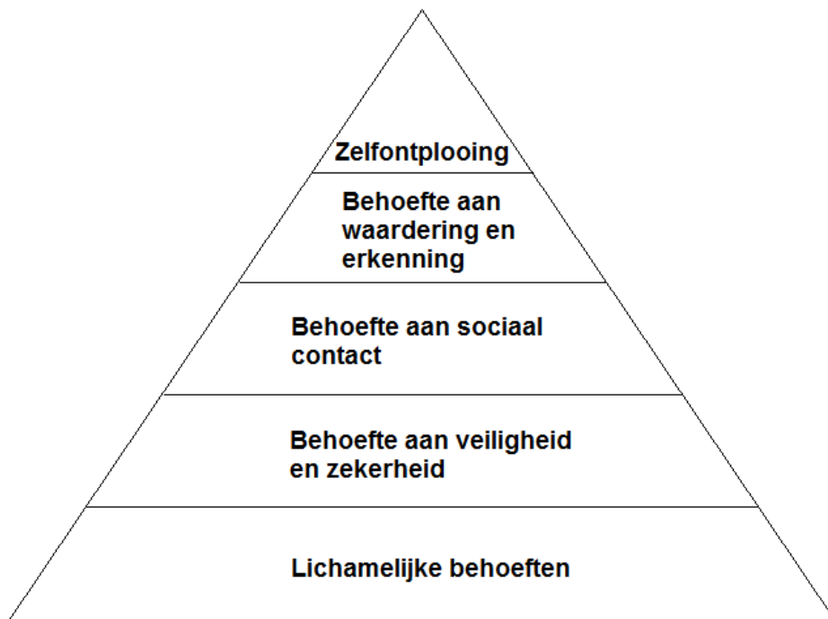
Afbeelding nr. 3 (De behoefttepiramide van Maslow, 1943)

Onderaan de piramide vindt men de lichamelijk behoeften. Deze houden verband met het lichamelijk evenwicht van de persoon. Een mens heeft behoefte aan slaap, voedsel, drinken, sport, comfort, ...Als tweede is er de behoefte aan veiligheid en zekerheid. Dit kan een persoon in een georganiseerde groep vinden. Het kan gaan om kleine of grote groepen in de buurt, het gezin of in een bedrijf. Ze vinden zekerheid binnen hun huisvesting, werk en relaties. Dit brengt ons naar het volgende: behoefte aan sociale contacten en saamhorigheid. Een mens heeft nood aan contacten die zorgen voor vriendschap, liefde en positieve sociale-relaties. De contacten zorgen ervoor dat een persoon zijn behoefte aan waardering en erkenning kan bevredigen. Hij krijgt meer zelfrespect en kan belang hechten aan de status in een sociaal verband. Ten slotte kun je in de top van de piramide de behoefte zelfontplooiing vinden. Een persoon heeft de behoefte om zijn persoonlijkheid en zijn mentale groeimogelijkheden te ontwikkelen. (Maslow, 1943)