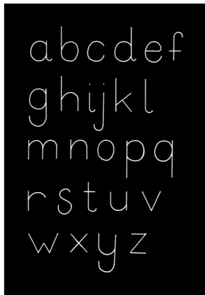
Figuur 16: Basisletters

De expressie van deze vernieuwende letters vormen de inhoud, er hoeft dus niet noodzakelijk een boodschap aan verbonden te zijn. De inhoud van woorden of zinnen kan erg dominant zijn, vandaar mijn keuze om me binnen dit project te beperken tot enkel letters. De essentie van dit project ligt dus in het zoeken naar een vernieuwende vormtaal. Dit is evenwel de reden waarom ik me niet gericht heb op het ontwikkelen van woordbeelden waarbij inhoud wel van belang is.