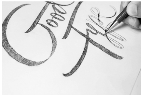
Figuur 2: (Hand)lettering door Martina Flor (Flor, 2014)