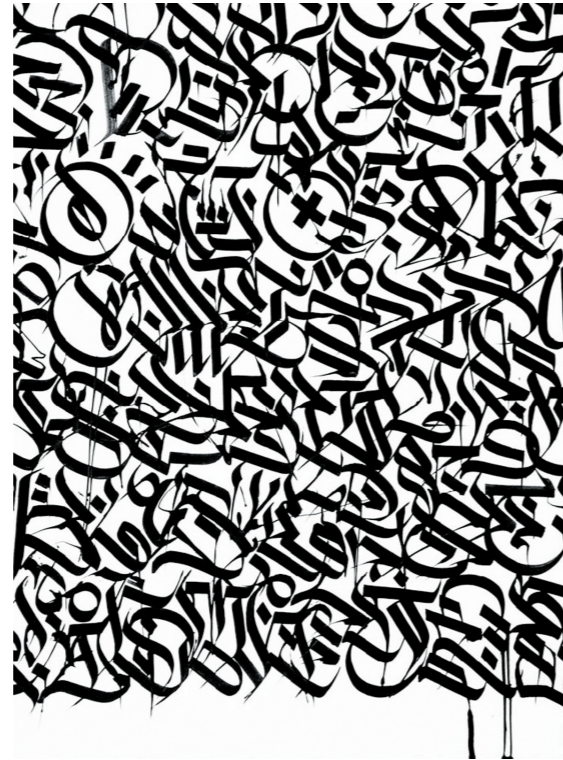
Figuur 5: Detail, Drury Brennan (Junique, 2014)