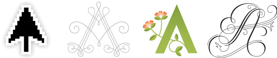
Figuur 8: Vier keer de letter A uit het 'Daily drop cap' project (Hische, 2011)