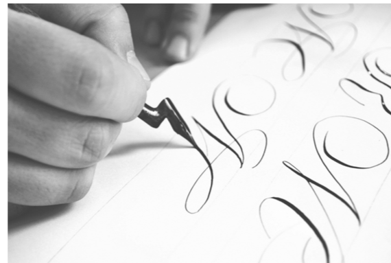
Figuur 3: Kalligrafie door Giuseppe Salerno (Salerno, 2013)