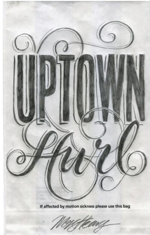
Figuur 4: Uptown Hurl door Gemma O'Brien (Pedestrian, 2014)