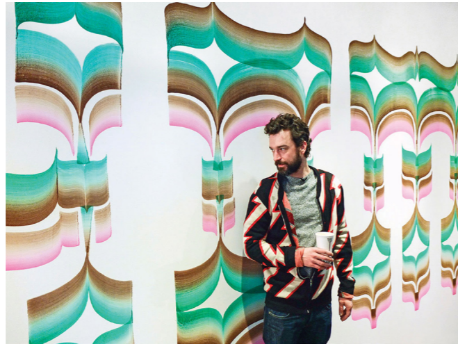
Figuur 7: Home door Job Wouters (Walker Art Center, 2013)