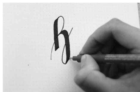
Figuur 14: Combinatie van platte kalligrafie pen en een dun zwart stiftje