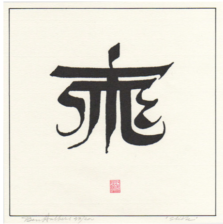
Figuur 6: Stilte , Ben Aalbers (Etty-Aalbers, 1996)