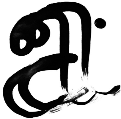
Figuur 15: Letter a, gebaseerd op de Bodoni