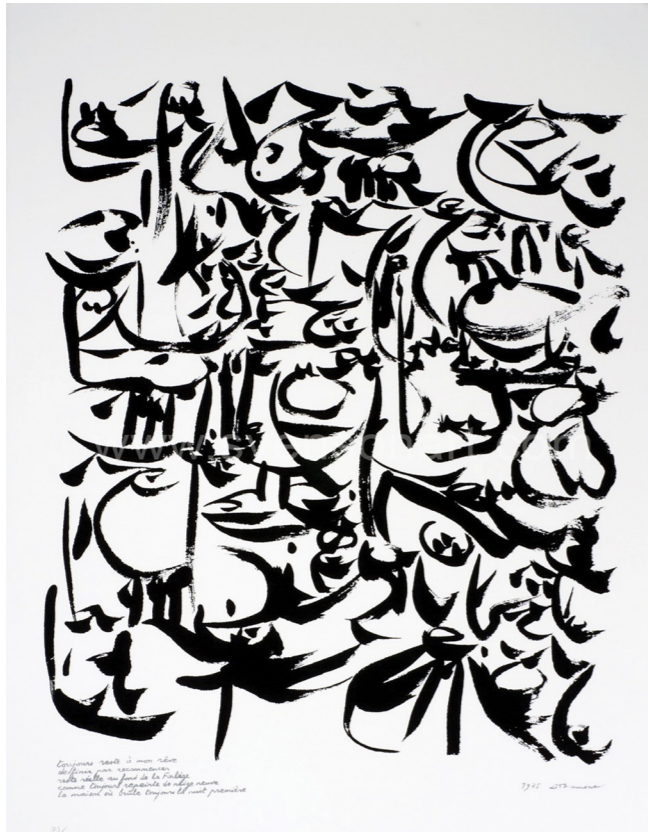
Figuur 9: Logogram: Toujours reste à mon rêve , Christian Dotremont (Svensonart, 2014)

ontwikkelen van een nieuwe en unieke taal, waarvoor hij zich laat inspireren door Arabische en Aziatische tradities (Etty-Aalbers, 1996).