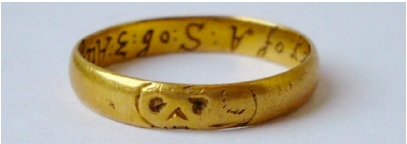
Fig. 1 Gold mourning ring, 1673 Gold.

De vanitas 17 die in de 16 e en 17 e eeuw een belangrijk thema werd in de kunsten herinnerde de mens aan de vergankelijkheid. Daarvoor gebruikte men symbolen zoals een zandloper, schedels, kaarsen of bloemen om de mens aan de beperkte tijd te herinneren die men hier op aarde heeft. 18 Vanitas was een thema in de kunsten, met name in de schilderkunst en juweelkunst. In navolging van de vanitas gedachte, kwamen ook 'memento mori' ringen (Fig. 1) in de middeleeuwen in de mode. Zij droegen vaak letterlijk de boodschap "Gedenk dat je zal sterven" met zich mee. Door het veelvuldig gebruik van skeletten en teksten over de naderende dood, was de dood dagelijks zichtbaar aanwezig. 19 Toch stond alles, hoewel men de eindigheid van het leven verkondigde, nog steeds in teken van de eeuwigheid, een leven na de dood. Dit in contrast tot bijvoorbeeld de opvattingen in de klassieke oudheid, waarbij de dood als einde werd gezien van alles. Tegen de 17 e eeuw fungeerden de memento mori ringen steeds minder als waarschuwingen voor de eindigheid van het leven en bleef de herinnering aan de overledenen als duidelijkste teken over. 20