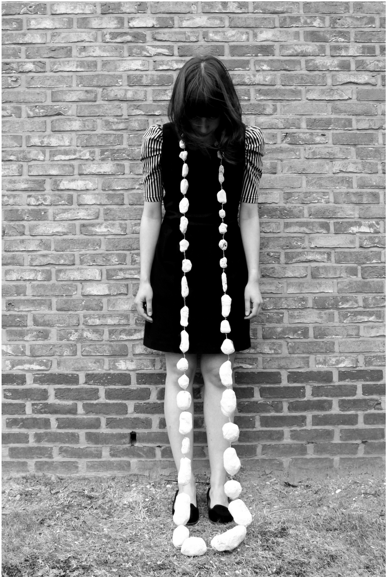
Fig. 2 Machteld Lambeets Dust. 2014 Polyurethaan, ijzer, houtschaafsel.