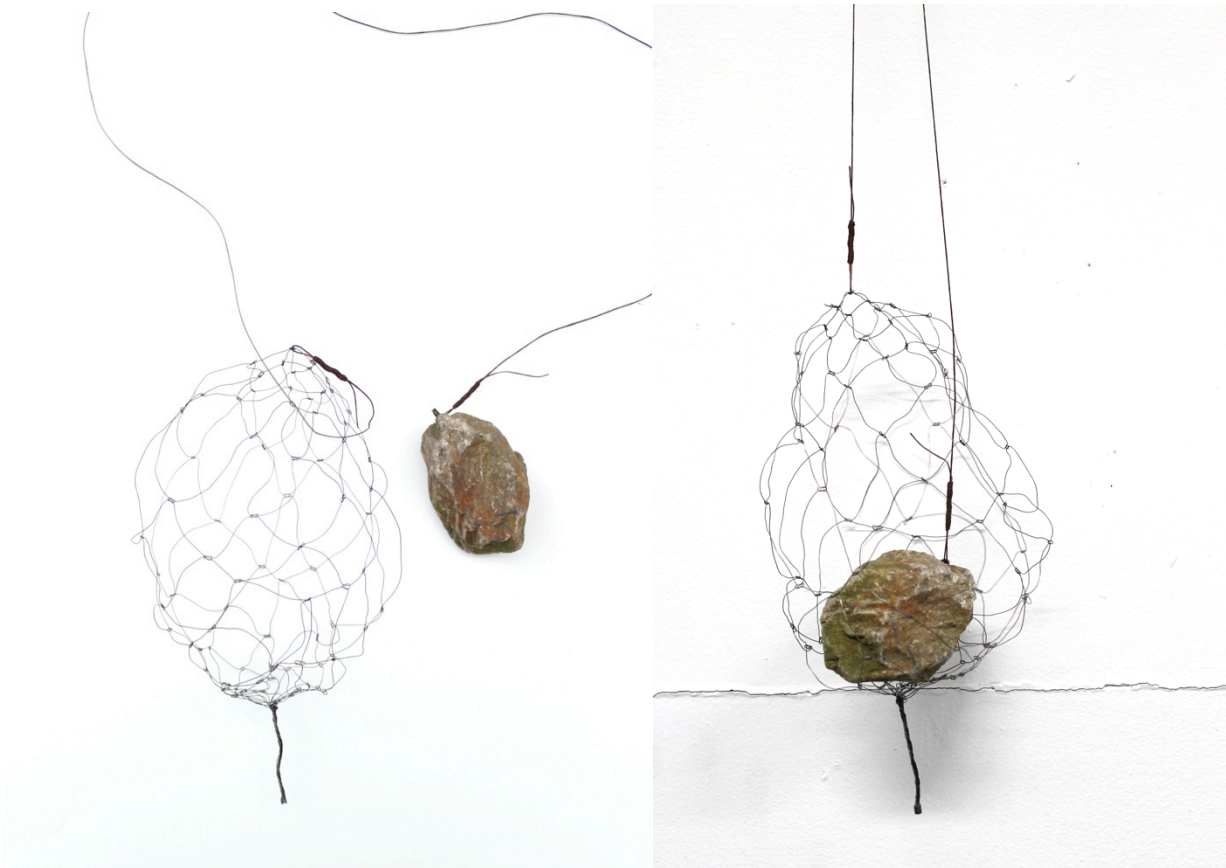
Fig. 3 Machteld Lambeets Houd me vast , 2014 IJzer, steen, zilver, draad.

Het werk ' Houd me vast ' (Fig. 5) is een poging om de hemel en aarde te verbinden, om leven en dood, het onbekende en gekende te verenigen met elkaar. De steen ligt rustig als altijd in de hand, onverstoort. Daartegenover staat een vorm die lijkt op de steen maar leeg en lichte is. De draadstructuur is leeg en zo groot dat hij kwetsbaar is in zijn bestaan. De draden lijken op een net, maar het bevat geen andere inhoud dan de lucht om ons heen. Daardoor zijn de steen en de draden in wezen tegenovergesteld omdat de steen de grond bevat en het net de lucht. En toch stel ik deze verklaring meteen in vraag, want hoewel de twee vormen tegenovergesteld lijken, doen ze hetzelfde doordat ze het 'niets' behelzen: de draden omklemmen de ongreepbare lucht en de steen bestaat enkel uit een vergankelijk stofje. De dood wordt gesymboliseerd als een verbinding tussen hemel en aarde, tussen wetenschap en godsdienst en tussen het tastbare leven en de ongreepbare dood. Door deze twee objecten bij elkaar te plaatsen wil ik deze sfeer van verbindingen oproepen.