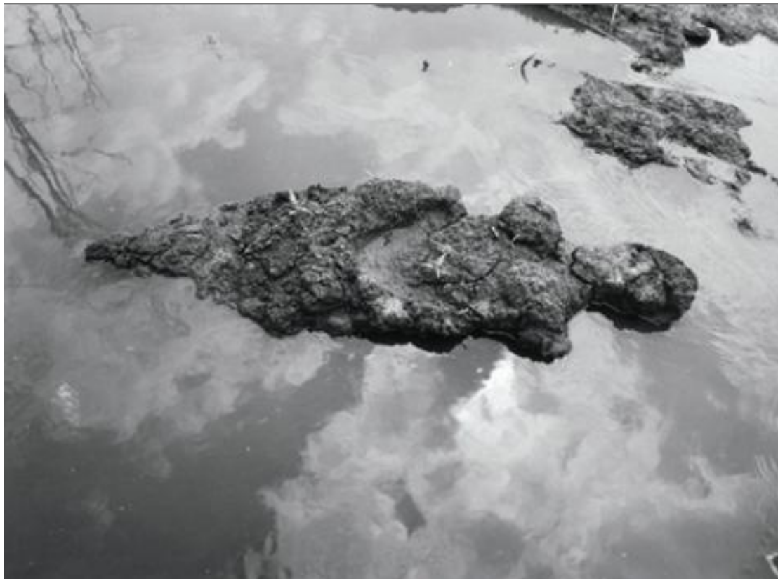
Fig. 3 Ana Mendieta Isla , 1981/1984 Zwart-wit foto, 101 x 76 cm

Ik zie de natuur maar vooral de sfeer van de dood die over haar werk hangt, hoewel deze niet gewelddadig is, voor mij, in 'Isla' (Fig. 3). Het drijvende silhouet van een levenloos lichaam veroorzaakt een link in mijn gedachten met begrafenisrituelen. Waarin bijvoorbeeld het levenloze lichaam in een bootje gezet wordt om de rivier over te steken naar het hiernamaals. Deze foto is niet geheel dood en verlaten, want hoewel het silhouet een connotatie heeft met een dood lichaam, wordt toch de sfeer opgelicht door de hemel die in het water weerspiegelt. De hemel is een symbool is voor vrijheid, weidsheid en hoop. Het hemelgewelf dat boven onze hoofden altijd aanwezig is als een ankerpunt in ons leven, is door zijn connotaties, één van de redenen dat ik de dood niet als geheel zwart of hopeloos ervaar. De hoop en vrijheid die in de hemel omvat zitten, tracht ik in mijn objecten te vatten door open, grote draadvormen, die als het ware de lucht omvatten en in de stenen komt deze hoop naar voren door de lichtheid en standvastigheid van hun materie.