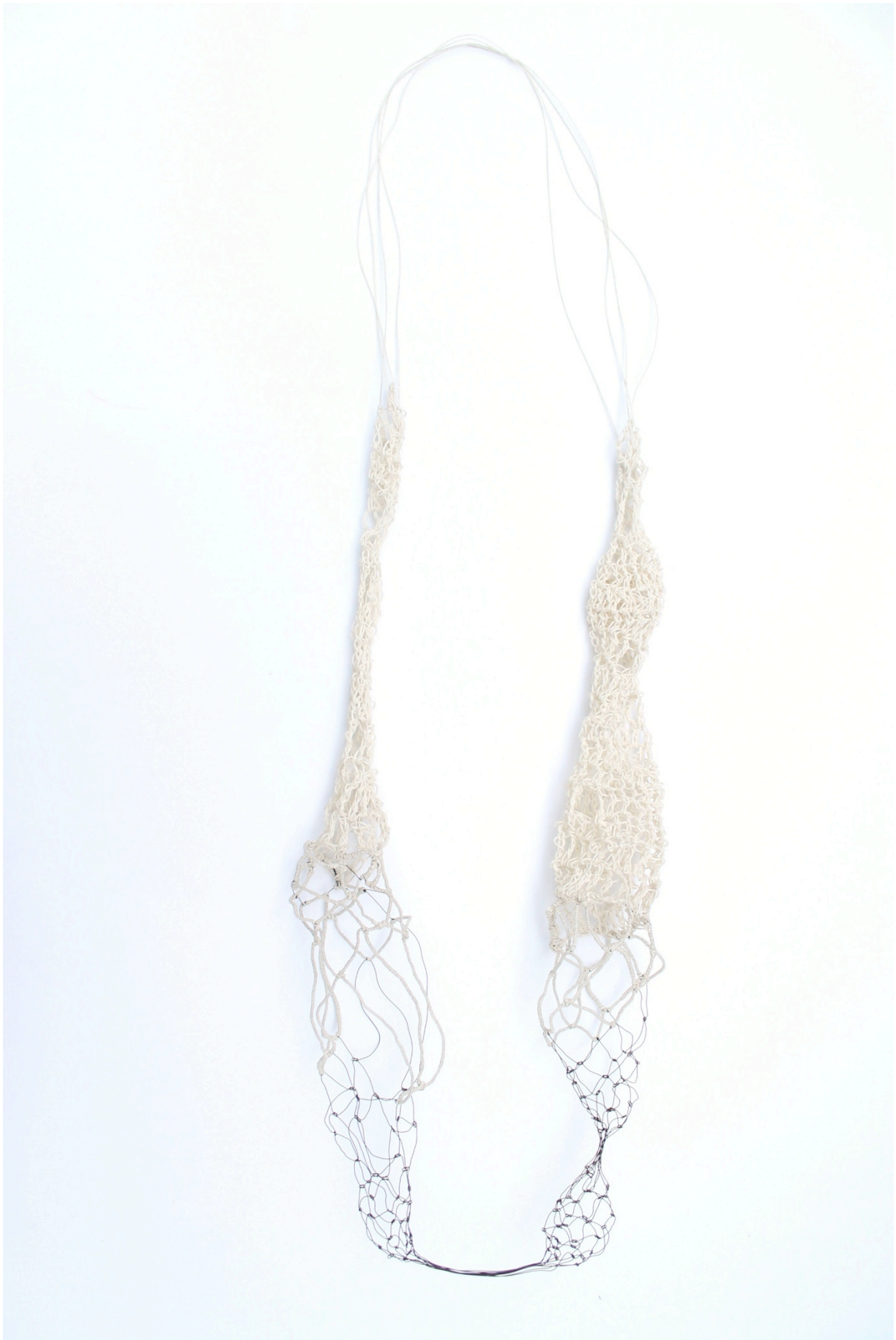
Fig 10. Machteld Lambeets Als ik troost kon zijn III, 2014 IJzer, waxdraad(linnen)