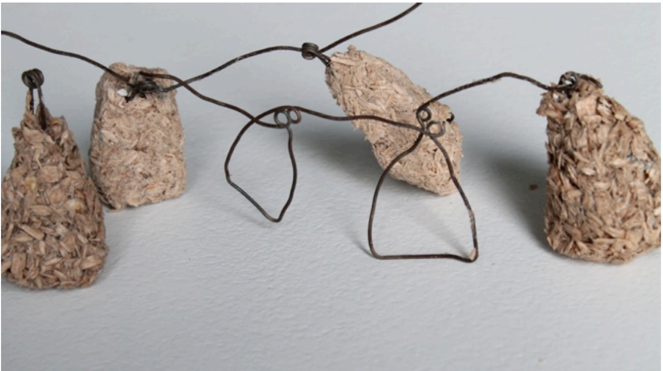
Fig 11. Machteld Lambeets Luchtige aarde, 2014 Ijzer, messing, houtschaafsel, lijn

Het gehaakte gedeelte in de halssieraden is een ondersteuning voor het kwetsbare draad gedeelte. Haken en breien zijn technieken die men gebruikt om dekens en truien te maken, vaak samenhangend met een familiale sfeer. Het roept de associatie op met grootmoeders en moeders die hun kroost in de koude winter willen beschermen tegen de koude. De gehaakte structuur is in de meeste gevallen hier dan ook de grootst ondersteunende factor, ook al dreigt hij soms zelf uiteen te vallen.