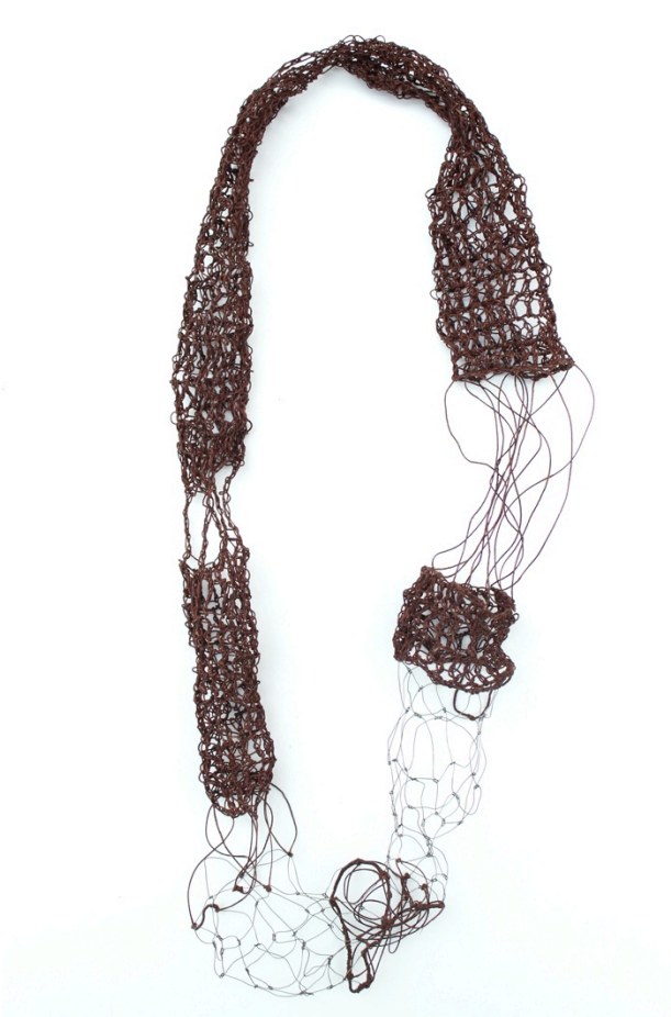
Fig. 8 Machteld Lambeets Als ik troost kon zijn, I, 2014 IJzer, waxdraad(linnen)

Hesse wou 'het niets' bereiken waarin ze de absurditeit van het leven zag doorschemeren. 65 Eerder in mijn werkproces had ik twijfels over die leegte in de draadobjecten. 'Alleen zijn, stil' (Fig. 7), leek soms zo leeg dat hij niet bestond of geen aandacht kreeg. Het heeft een tijd geduurd om te beseffen dat net deze leegte en 'niet-zijn' passend zijn voor deze objecten, net omdat de dood de pure leegte belichaamt. De dood is het niet-zijn voor de mens, de leegte die we allen tegemoet gaan maar toch niet geheel kunnen bevatten aangezien we in het ontastbare grijpen.