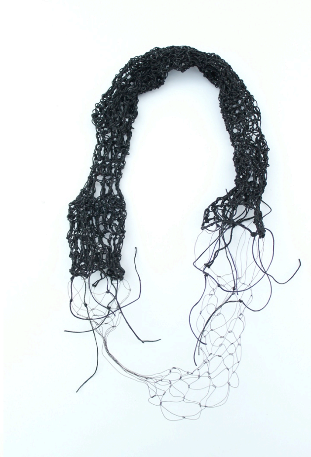
Fig. 9 Machteld Lambeets Als ik troost kon zijn, II, 2014 IJzer, waxdraad(linnen)

'Right after' (Fig. 6) van Eva Hesse roept bij mij een gedachte aan Moira, de schikgodinnen op. De mythe gaat dat zij de fragiele levensdraad van de mens sponnen en beslisten over het moment van het doorknippen, de dood. 66 De fragiele draden in de lucht lijken immers zo kwetsbaar te zijn dat ze ieder moment kunnen doorknappen, dat hen geen lang leven beschoren is. 'Right after' (Fig. 6), dat uit glasvezels is opgebouwd, kan in zijn fragiliteit niet lang bestaan. Vele van Eva Hesse's werken vielen uiteen en zijn zo kwetsbaar dat gedurende langere tijd tentoonstellen tot beschadiging leidt. 67 Door een verkeerde beweging kan men de draden namelijk doen breken en vernietigt men zijn originele staat. De draadobjecten zoals 'Alleen zijn, stil' (Fig. 7) vatten niet enkel het niets maar ze bevatten ook een broosheid die met liefde en zorg intact gehouden moet worden. Want deze draden vormen een skelet, een fundament van iets dat ooit gaat zijn, iets dat op het begin staat van een nieuw leven.