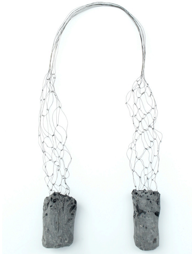
Fig. 4 Machteld Lambeets Withstand, 2014 Ijzer, polyurethaan, houtschool assen.

Iedere keer dat de mens aan de dood denkt en zijn vergankelijkheid ten volle beseft, ontspringt er een nieuw levensbesef. Het leven kan niet zonder de dood en dat geldt ook andersom. 'Withstand' (Fig. 4) draagt een last met zich mee die het hele juweel naar de aarde dreigt te sleuren en toch houdt het schijnbaar fragiele gedeelte stand in zijn vormelijkheid. De draden zitten verankerd in de steen alsof ze de steen nodig hebben om hen steun te geven. Ze bouwen een lichaam op naar boven toe tot ze in lijnen uiteenvallen. Aan de onderkant komt de steen ter hulp, de sterke rots is een steun en last tegelijkertijd. Want een steen is een last, maar het kan evenzeer de rots zijn waar je op kan steunen in moeilijke momenten. Een rots waar je sterkte en moed kan uithalen, zolang je de steun en niet enkel de last in hem wil ontdekken.