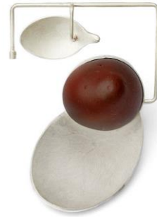
Afb. 20: Katja Prins, (2007) Continuum, broche, zilver en was, afmetingen 83 x 76 x 35mm

De serie Continuum (afbeelding 20) is een voorbeeld van die extensies aan het lichaam. Hier spelen zich tegenstellingen af in de vorm en het materiaal dat ze gebruikt, het harde, vaste zilver en de zachte, vloeibare was. De composities die zij maakt staan in contrast met het lichaam maar lijken hier toch thuis te horen door het materiaalgebruik en de vormgeving die duidelijk hierop geïnspireerd is (deDuits, 2008). Dit komt ook terug in mijn project, het constructie aspect staat in contrast met het lichaam. Maar dankzij het gekozen materiaal, het roze kunststof, is de lichamelijke van de stukken niet ver weg.