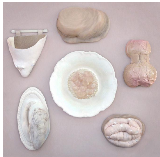
Afb. 21: Hyunjung Cho, (2011) Embodied, broches.

Zij onderzoekt de interactie tussen sieraden en het mentale aan de hand van het onverwachte en niet ideale lichaamsbeeld, zoals bijvoorbeeld het gevoel dat we krijgen wanneer we bij een andere vrouw lichaamsbehaaring zien. Deze mentale gebeurtenissen uit ze in de vorm van sieraden die het naakte en tegelijkertijd het culturele lichaam uitbeelden. Zij spreekt alsook over naakte vormen die zich als een extra laag op het lichaam bevinden en een ongemakkelijk gevoel moeten overbrengen op de drager en toeschouwer (Hyunjung, n.d.). Dit project past van concept in de lijn van Bodyfittings. Zowel in de gebeurtenissen die zich afspeelen bij de drager en de toeschouwer wanneer de stukken gedragen worden als in de uitwerking die op het lichaam geïnspireerd is.