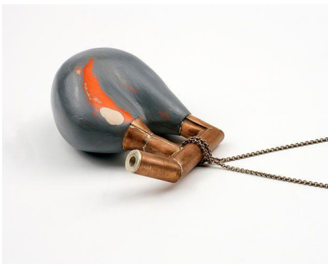
Afb.18: Aran Galligan, (n.d) Contrasystem , halssieraad, mixed media.

Net zoals in de voorbeelden onderaan creëer ik vormen die op organen lijken. De constructie blijft hier ook aanwezig om de gelijkenis tussen machine en mens te aan te tonen. In mijn project maak ik geen vergelijking met machine maar wel met gebouwen, toch ligt de uitwerking hiervan dicht bij elkaar.