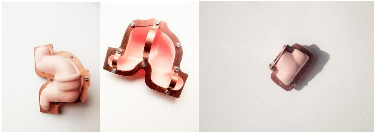
Afb. 12, 13 en 14: Eigen foto, (2015) proefstukken van de uiteindelijke uitwerking van Bodyfittings. Afmetingen afb. 12 en 13: 11x8,5cm, afb. 14: 7x5cm.

Nog een manier om de koperen verbindingstukken te gebruiken zonder het geheel te zwaar te maken is om de koperleidingen te kopiëren in een ander materiaal. Dit doe ik aan de hand van het thermoformeren, de vorm van de verbindingstukken blijft herkenbaar en ik kan eindeloos combinaties maken zonder de technische moeilijkheden zoals het aan elkaar solderen van de aparte stukken. Thermoformeren is het nabootsen van een vorm in kunststof door middel van hitte en vacuümtrekken. 9 Het soort kunststof dat ik gebruik is een rubbervel dat ook wel gebruikt wordt als knutselmateriaal. Dit is een zacht, delicaat materiaal dat in mijn project gebruikt wordt om organen na te bootsen. Wanneer dit wordt vacuümgetrokken verandert dit materiaal naar een holle vorm dat men kan indrukken. De roze kleur dient om het lichamelijke nog eens extra te benadrukken. Alsof de sieraden een nieuwe laag zijn van het lichaam.