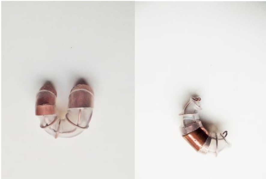
Afb. 10 en 11: Eigen foto's (2015) Buisvormen uit koper en krimpkous geïnspireerd op industriële pijpleidingen. Afmetingen afb.10: 7x6,5cm, afb.11: 9x5cm

Op afbeelding 4 en 5 is te zien hoe de vormen meer organisch worden en een stap dichtter staan bij het lichamelijke. Hier ben ik naar op zoek om de connectie met het lichaam te benadrukken aan de hand van vorm en eventueel materiaal. Het organische wordt hier gecreëerd door zelf met koperen draad een vorm te bepalen, hier is de buisstructuur nog altijd aanwezig. Deze constructie uit draad zorgt voor een open structuur, om het idee van leiding te behouden is de structuur toegewerkt met krimpkous. Dit is een materiaal uit plastic dat door middel van hitte krimpt in de diameter. Het omsluit de vorm waarrond de buis getrokken is. (Wikipedia, 2014) Daarom is dit een ideaal materiaal om de structuren dicht te maken en toch de vorm niet verloren te laten gaan. Krimpkous is verkrijgbaar in verschillende kleuren, hier is de transparante variant gebruikt om de draden nog zichtbaar te laten. De vorm van deze stukken blijft bruut