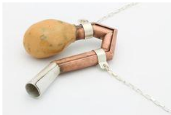
Afb.19: Aran Galligan, (n.d) Reconstruction unit , halssieraad, mixed media.