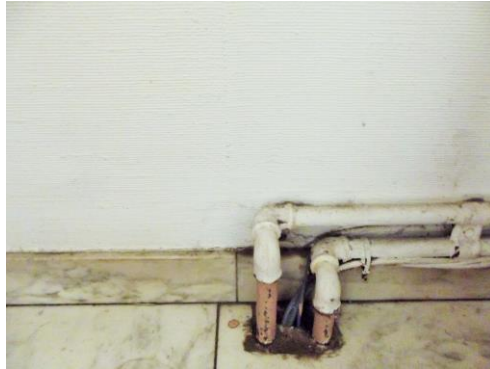
Afb. 4: (2015) voorbeeld van leidingen die van binnen naar buiten lopen.

Het menselijk lichaam is naast een conceptuele basis voor Bodyfittings ook een vormelijke inspiratiebron. De mentale ervaring uit zich in het conceptuele deel en de fysieke vormen komen terug in de uitwerking van Bodyfittings. Ik zie het lichaam in dit project ook als display of tentoonstellingsruimte, het is daar waar het idee tot uiting komt. Het lichaam is nodig voor het idee van de bewustwording over te brengen op de drager zelf die het concept nog het meest ervaart. In de vormelijke uitwerking van Bodyfittings heb ik de ruimte verder getrokken en dienen functionele constructie-elementen die voorkomen in de muren van gebouwen als inspiratiebron. De aders van het gebouw zoals buizen of leidingen, die van binnenin naar buiten lopen.