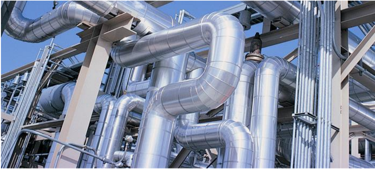
Afb. 9: Voorbeeld van industriële pijpleidingen.