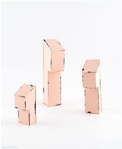
Afb.17: Sara Borgegard, (2011) Twilight , broches, ijzer & verf.

In Bodyfittings toon ik het geconstrueerde om de link met de installatie van leidingen in het huis duidelijk te maken. Dit doet zij ook via het zichtbaar laten van de opbouw in de objecten om haar idee over de constructie van gebouwen te tonen. De slijtage van de verf doet denken aan het koper dat ik toelaat om te oxideren zodat het idee van tijd en verandering ook zichtbaar wordt.