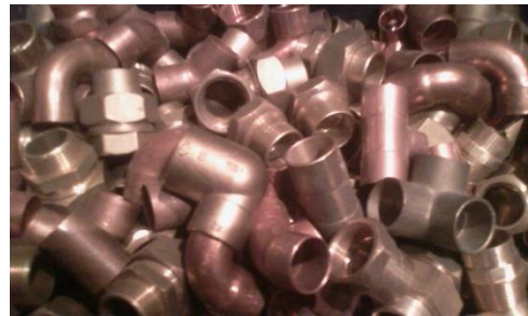
Afb. 5: (2015) verbindingstukken uit koper en messing.

De bedoeling is om een extra kunstmatige laag te bouwen op het lichaam in de vorm van sieraden. Via leidingen vorm ik een mentale verbinding tussen de binnen en de buitenkant van het lichaam. In het volgende deel 3.3 UITWERKING, wordt getoond hoe die verbindingen tussen binnen en buitenkant van het lichaam evolueren van letterlijk naar figuurlijk. Koperen buizen worden gebruikt als aanvoerleidingen in gebouwen. De belangrijkste toepassingen hiervan zijn de verdeling van koud en warm water en verwarmingsleidingen. Roodkoperen buizen zijn er in twee uitvoeringen, zachte buis en harde buis. Het verschil zit in de bewerkbaarheid van de materialen, zacht koper is makkelijker vorm te geven en ideaal voor het gebruik in vloeren en muren. (van Cotthem J.C., 2000)