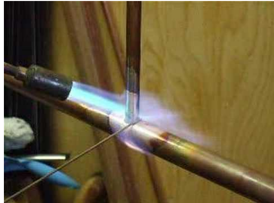
Afb. 6: De uitvoering van de brasseertechniek.

Het idee is vertrokken met leidingen letterlijk te gebruiken in mijn sieraden en hiermee een constructie te bouwen die van binnenuit naar buiten lijken te lopen. In de uitvoering van de stukken heb ik inspiratie gehaald uit de technieken die worden gebruikt bij het installeren van koperleidingen, zoals bijvoorbeeld de brasseertechniek. 8