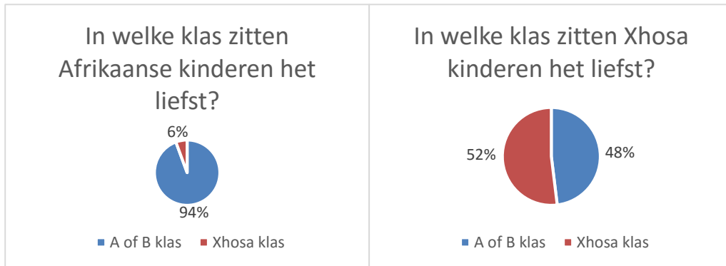
Figuur 1: taartdiagram klas

Bij de vraag in welke klas zij het liefst willen zitten zien we wel een opmerkelijk verschil. Dit is af te lezen in de bijgevoegde grafiek. Hieruit blijkt dat 52% (n=161) van de Xhosa kinderen liever in een Xhosa klas zou zitten in plaats van in de A of de B klas waar les gegeven wordt in het Afrikaans. Bij de Afrikaanse kinderen is dit amper 6% procent. Waarom zij liever naar de Xhosa klas willen overstappen werd niet aangegeven.