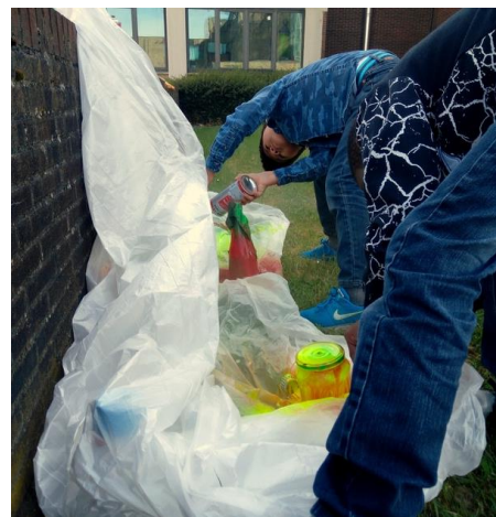
Figuur 6: Versieren instrument