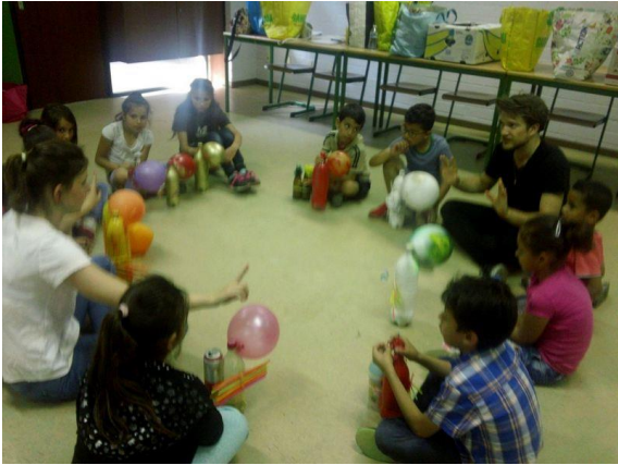
Figuur 7: Voorstelling instrument