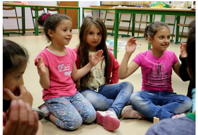
Figuur 2: Gebaar lang geluid