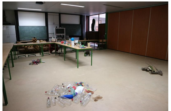
Figuur 4: Opstelling en doorschuifstelsel