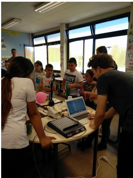
Figuur 9: Opname geluiden instrument