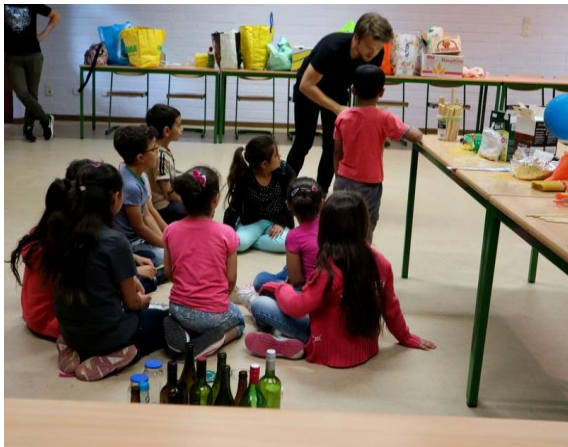
Figuur 1: Introductie