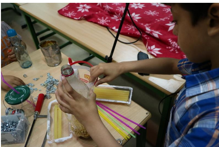
Figuur 5: Creëren instrument