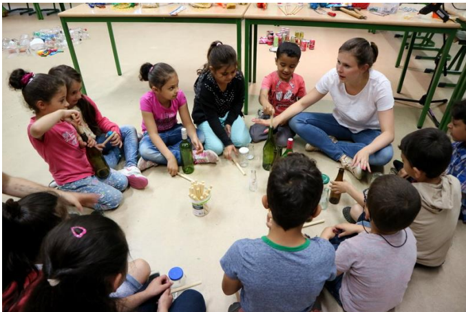
Figuur 3: Klassikaal experimenteren