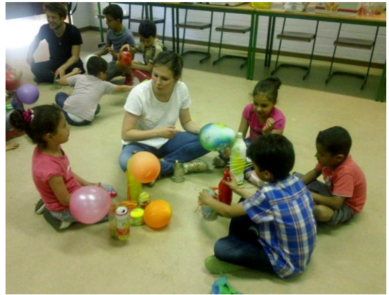
Figuur 8: Muziek maken