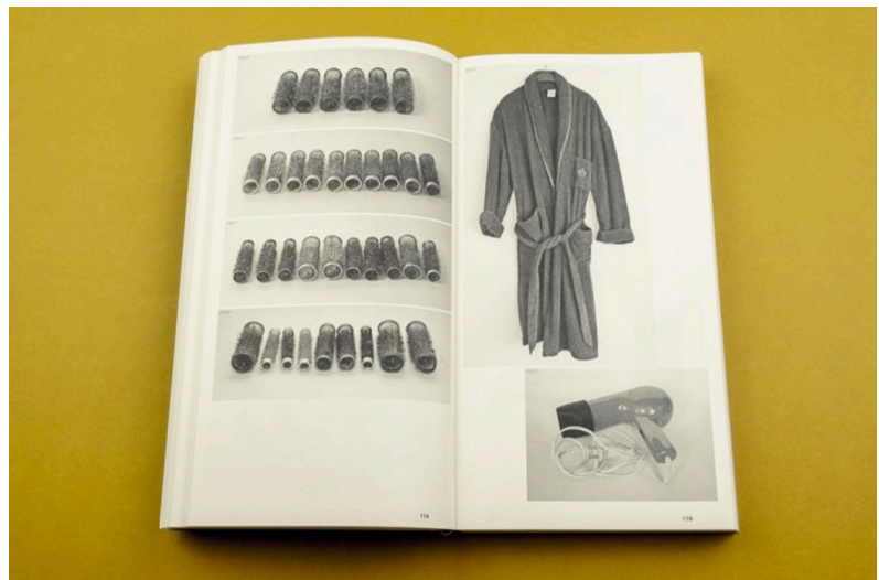
(afb. 14.) Grote, T. (2021). Eindhovenseweg 56 .