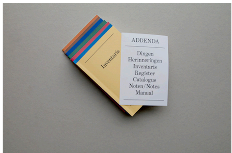
(afb. 1.) Rigole, J. (2015). Addenda .