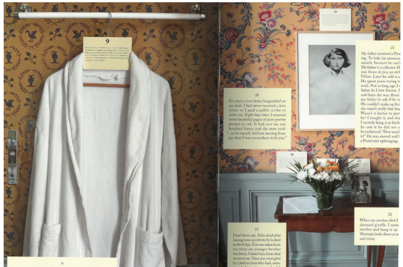
(afb. 4.) Calle, S. (2013). Room 20 .