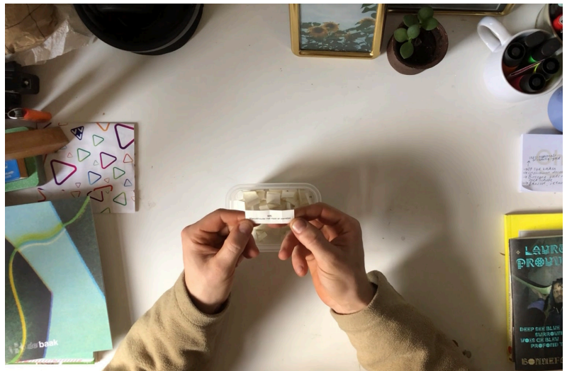
(afb. 2.) Mannens, C. (2022). Jij ontbreekt mij (lootje) .

Voordat het object in bruikleen werd genomen, werd er een lootje getrokken, waarop het nummer en de titel van het object stond. De mensen hadden dus niet volledig zelf de keuze om een object te lenen. Zou dit wel het geval zijn, dan was er geen sprake van spanning en verrassing. Wanneer het lot bepaalt, worden zowel ik als de bruiklener verrast met een object, waar de participant misschien vooraf geen link of connectie mee had. Zo wordt elk object ook gelijkwaardig behandeld waardoor ook een zeker favoritisme de kop ingedrukt kon worden (wie zou nu bijvoorbeeld niet Jason de steen willen hebben?).