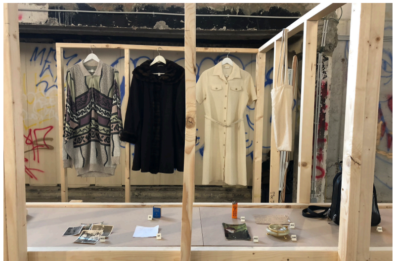
(afb. 10.) Mannens, C. (2022). Jij ontbreekt mij (De Uitleendienst) .