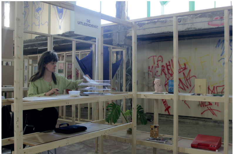
(afb. 9.) Mannens, C. (2022). Jij ontbreekt mij (De Uitleendienst) .