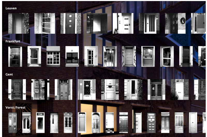
(afb. 6.) Vanhee, S. (2012). Untitled .