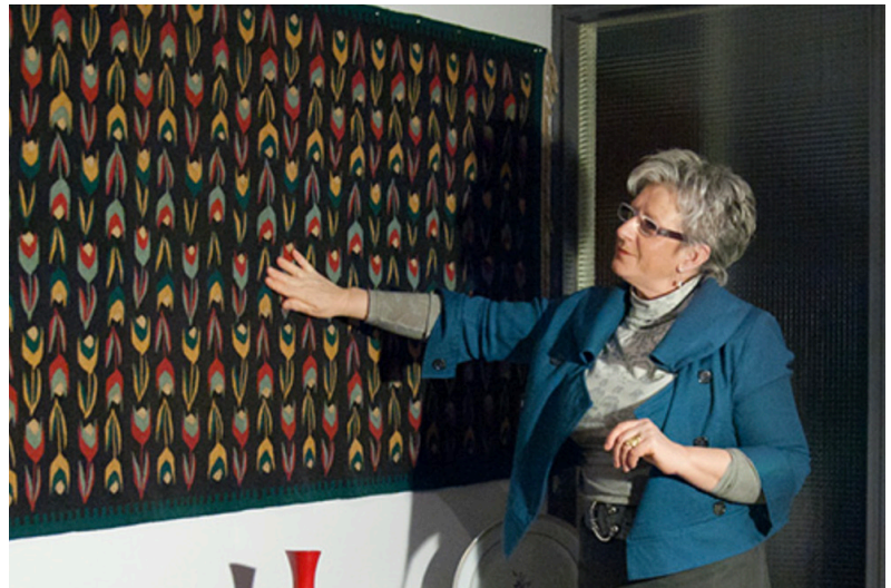
(afb. 7.) Vanhee, S. (2012). Untitled .