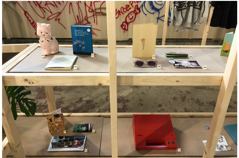
(afb. 8.) Mannens, C. (2022). Jij ontbreekt mij (De Uitleendienst) .