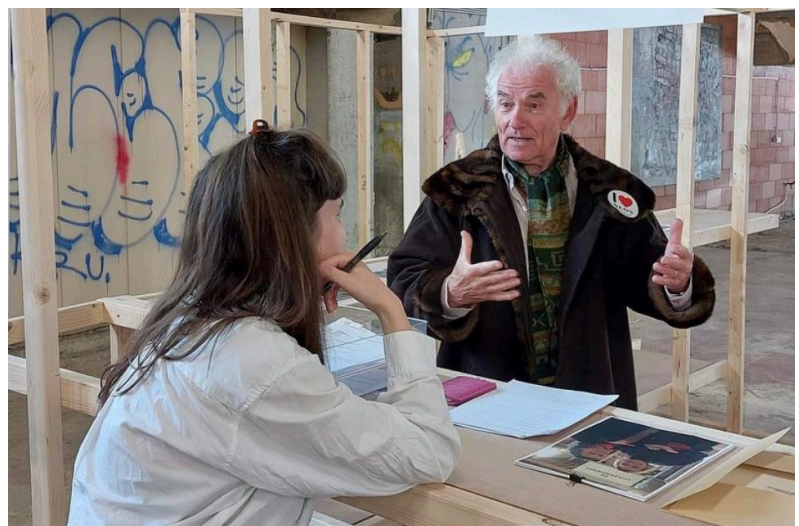
(afb. 5.) Mannens, C. (2022). Jij ontbreekt mij (intakegesprek) .