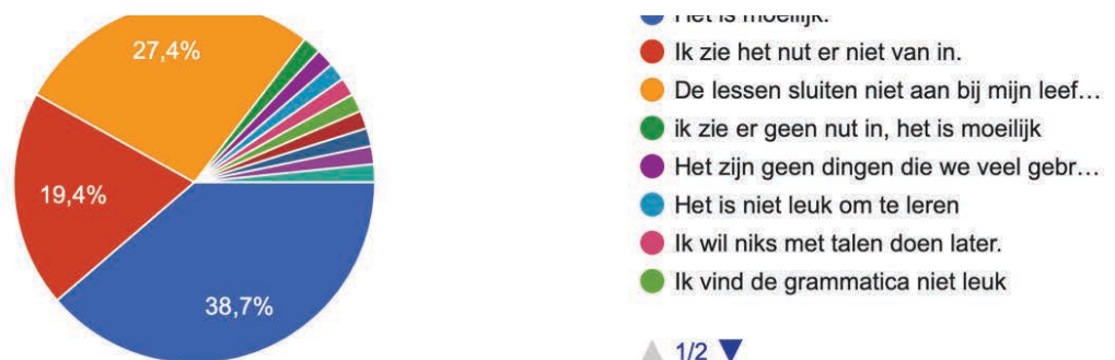
Figuur 3 Wat maakt dat je niet gemotiveerd bent voor het vak Frans?

Eenzijds vinden de leerlingen het vak Frans moeilijk. Ze durven dan ook geen Frans “en plein publique” te spreken. Ik merkte op dat tijdens de observatielessen bij de collega’s van het taalvak Engels dit helemaal geen obstakel vormde. Anderzijds zien ze het nut van deze taal niet in. Ze hebben geen connectie met deze vreemde taal.